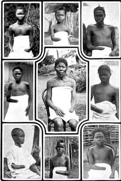
21 Als de kinderen die op de plantages werkten niet genoeg rubber ophaalden, werd hun hand afgehakt. Deze foto's werden als bewijsmateriaal verzameld in 1905.