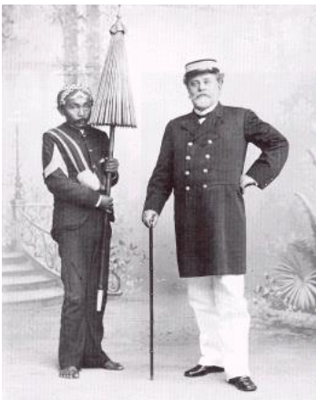
bron 5 - een bestuurder.