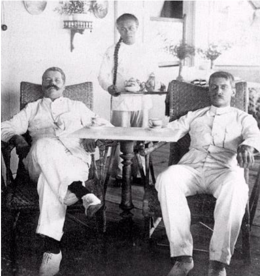
bron 11 - twee assistenten met een Chinese 'boy', Deli in 1905.