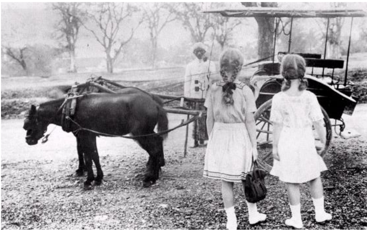
bron 4 - deze foto laat twee jonge meisjes zien op weg naar school. Rijtuigen waren in de tijd van tempo doeloe een belangrijk statussymbool.