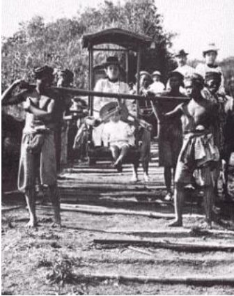
bron 6 - transport in het Oude Indië