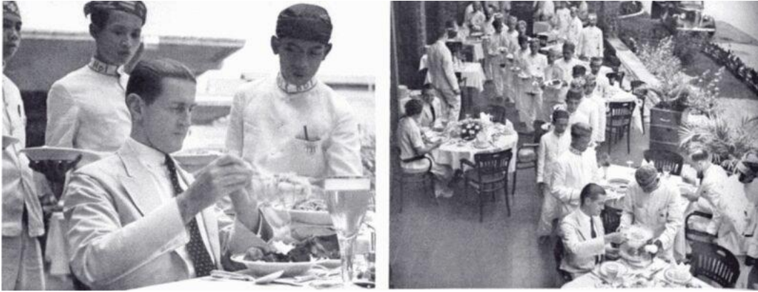
bron 3 - foto's van een maaltijd in Des Indes, Batavia.