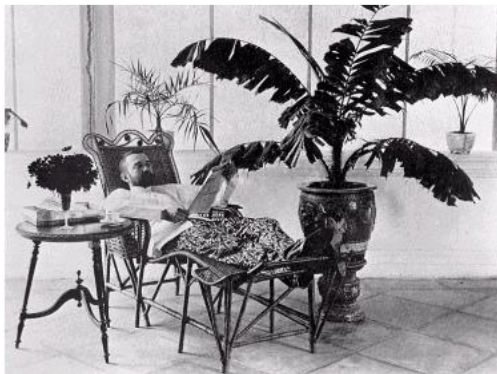
bron 7 - notabele uit Semarang in zijn luijerstoel.

bron 8 - Paul van 't Veer schreef in 1970: