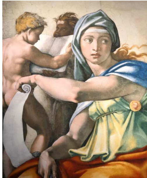
17 Een schilderij gemaakt door Michelangelo