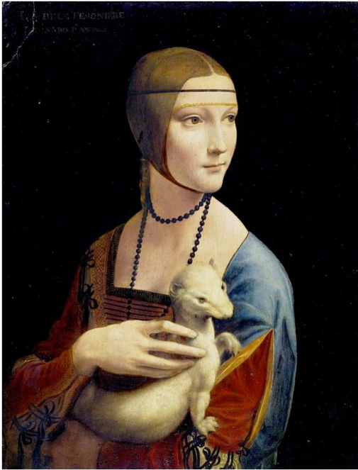
14 De dame met de hermelijn, één van de bekendste schilderijen van Leonardo da Vinci (1483-1490)