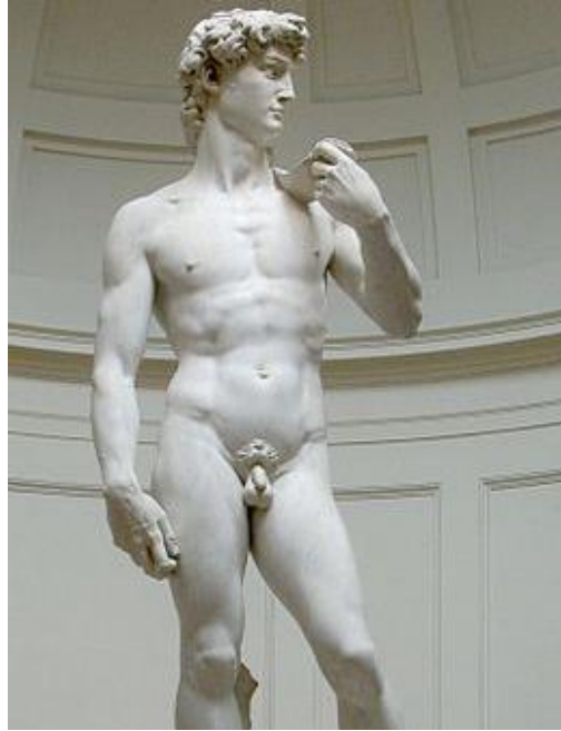
15 David, het bekendste beeldhouwwerk van Michelangelo (1501-1504)