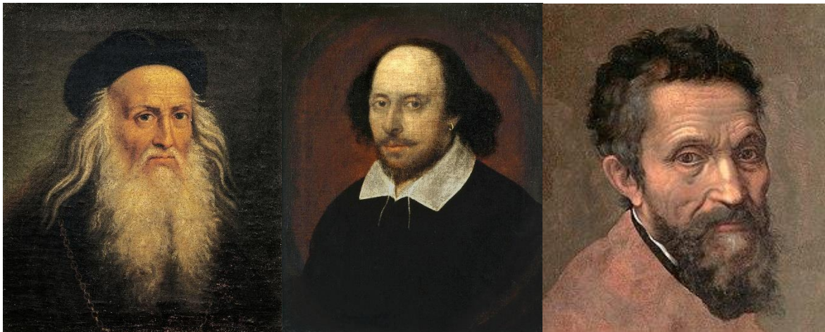
Leonardo da Vinci