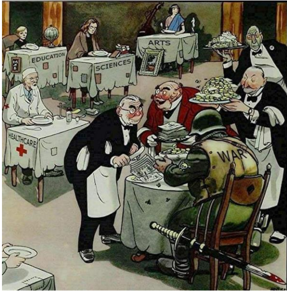
bron 4 – een prent uit 1950. Op de achtergrond staan tafels met daarop de teksten ‘gezondheidszorg, onderwijs, wetenschap en kunsten’. Op de voorgrond zit een man aan tafel met op zijn rug de tekst ‘oorlog’.