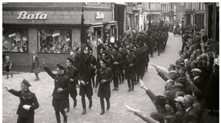
Bron 4 – een foto uit 1941, gemaakt in Nederland. Nederland werd door de Duitsers bezet in 1940. Er waren Nederlanders die ervoor kozen om zich bij de nazi's te voegen.