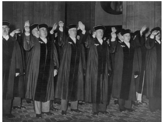
Bron 6 – een foto, mogelijk uit 1936, gemaakt in Duitsland. Waarschijnlijk leggen rechters hier vrijwillig de eed van trouw af aan Hitler.