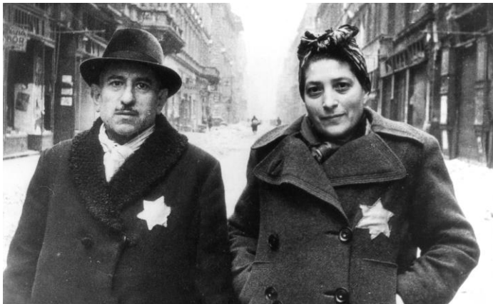
Bron 5 – een foto, mogelijk uit 1941, gemaakt in Duitsland. De laatste joden die nog in Duitsland waren, moesten een jodenster dragen.