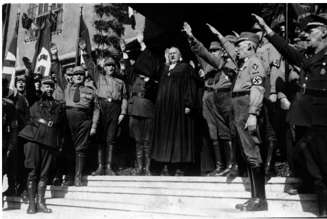
Bron 1 – Duitse christenen geven de Hitlergroet bij de synode van Wittenberg in september 1933

Bron 8: Is de bron representatief voor alle joden in Europa in 1943?