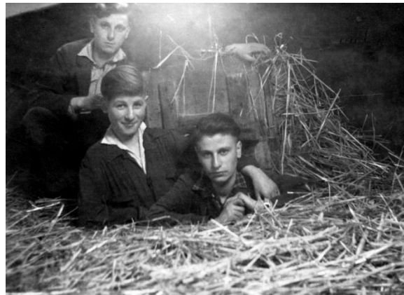
Bron 8 – een foto uit 1943, gemaakt in Nederland. Een groep joden was erin geslaagd een goed onderduikadres te vinden en zo de oorlog te overleven.