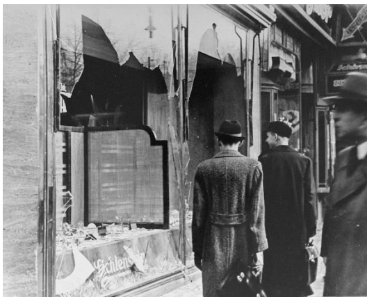
Bron 3 – een foto uit 1938, gemaakt in Duitsland. Joodse winkels worden tijdens de Kristallnacht verwoest.