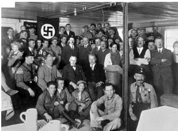
Bron 7 – een foto uit 1930, gemaakt in Duitsland. Adolf Hitler staat hier samen met enkele nazi's, nog enkele jaren voordat de NSDAP de grootste partij van Duitsland werd