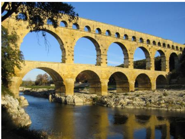
bron 2 - dit wereldberoemde aquaduct, de Pont du Gard (gebouwd in de eerste eeuw), steekt nog steeds 50 meter boven de Zuid-Franse rivier de Gard uit.