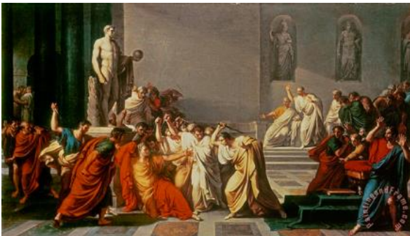
bron 4 - op 15 maart 44 v. Chr. lag Gaius Julius Caesar bloedend onder het standbeeld van zijn vroegere tegenstander Pompeius. Een schilderij van de Italiaan Camuccini uit 1798.

bron 5 - Paus Urbanus II roept in 1095 op tot een kruistocht: ‘Een goddeloos volk is het Heilige Land van de christenen binnengevallen. Ze doden christenen en vernielen de kerken. Als u deze ongelovigen niet tegenhoudt, zal Jeruzalem verloren gaan. Daarom smEEK ik u, ga naar het Heilige Land.’