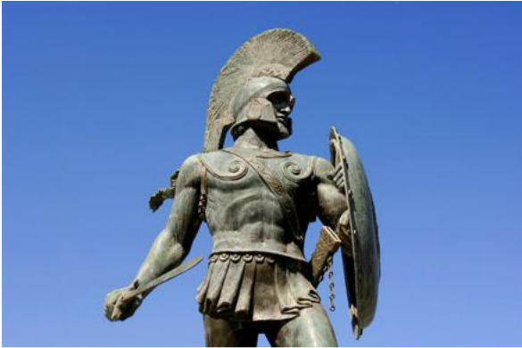
bron 3 - een standbeeld van de Spartaanse koning Leonidas. Hij stuurde de andere Grieken weg en hield met zijn driehonderd Spartanen de Perzen zo lang mogelijk tegen. In 1955 werd op de plaats van de slag dit standbeeld neergezet.