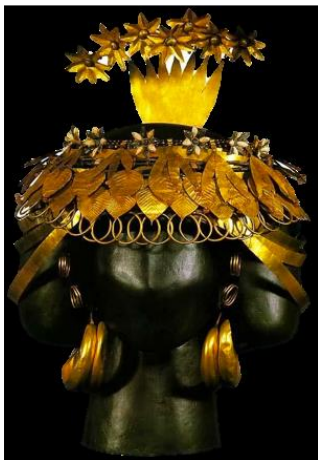
bron 1 - de hoofdtooi van de Egyptische koningin Puabi, gevonden in de koninklijke graf tombe van Ur. Gemaakt rond 1550-1400 v. Chr.