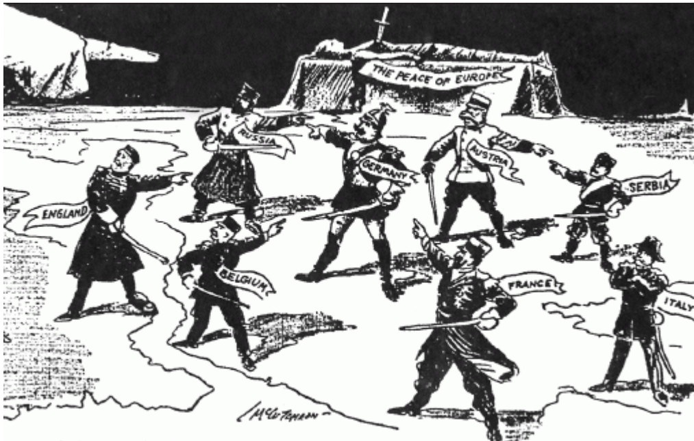
bron 1 – een prent door John McCutcheon (1914).