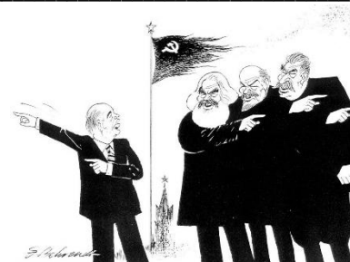
Prent links Gorbatsjov en rechts Marx, Lenin en Stalin.