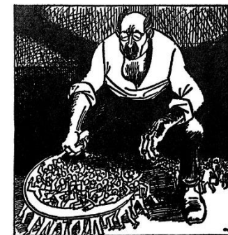
Prent met Albert Ulricht (leider van de DDR).