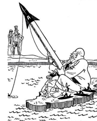
Prent met links John F. Kennedy en Uncle Sam (Amerika) en rechts Gorbatsjov en Castro.