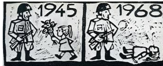
Prent met een Sovjetsoldaat en een meisje uit Tsjechoslowakije.