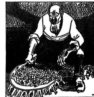
Prent met Albert Ulricht (leider van de DDR).