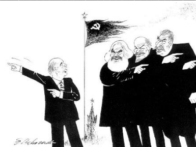
Prent links Gorbatsjov en rechts Marx, Lenin en Stalin.